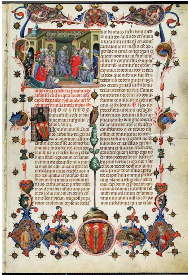
Manuscript of the Usatges de Bachelona with a promulgation decree by Alfonso III, king of Aragon, 1285-1291, but the ms. dates from the mid-14th century